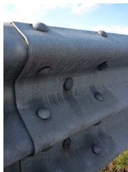
Figura 3 – Esempi di non integrità dei dispositivi di sicurezza

Con riferimento ai supporti (cordoli in c.a. per le barriere bordo ponte o il terreno per le barriere infisse), si evidenzia come la perdita di efficienza del supporto possa essere riscontrata sia direttamente che indirettamente (ad esempio, l'assenza di verticalità o la riduzione di quota delle barriere infisse può essere dovuta alla presenza di cedimenti delle banchine o dei terreni poco compattati). Dovranno quindi essere valutate, tra le altre, le seguenti possibili anomalie: